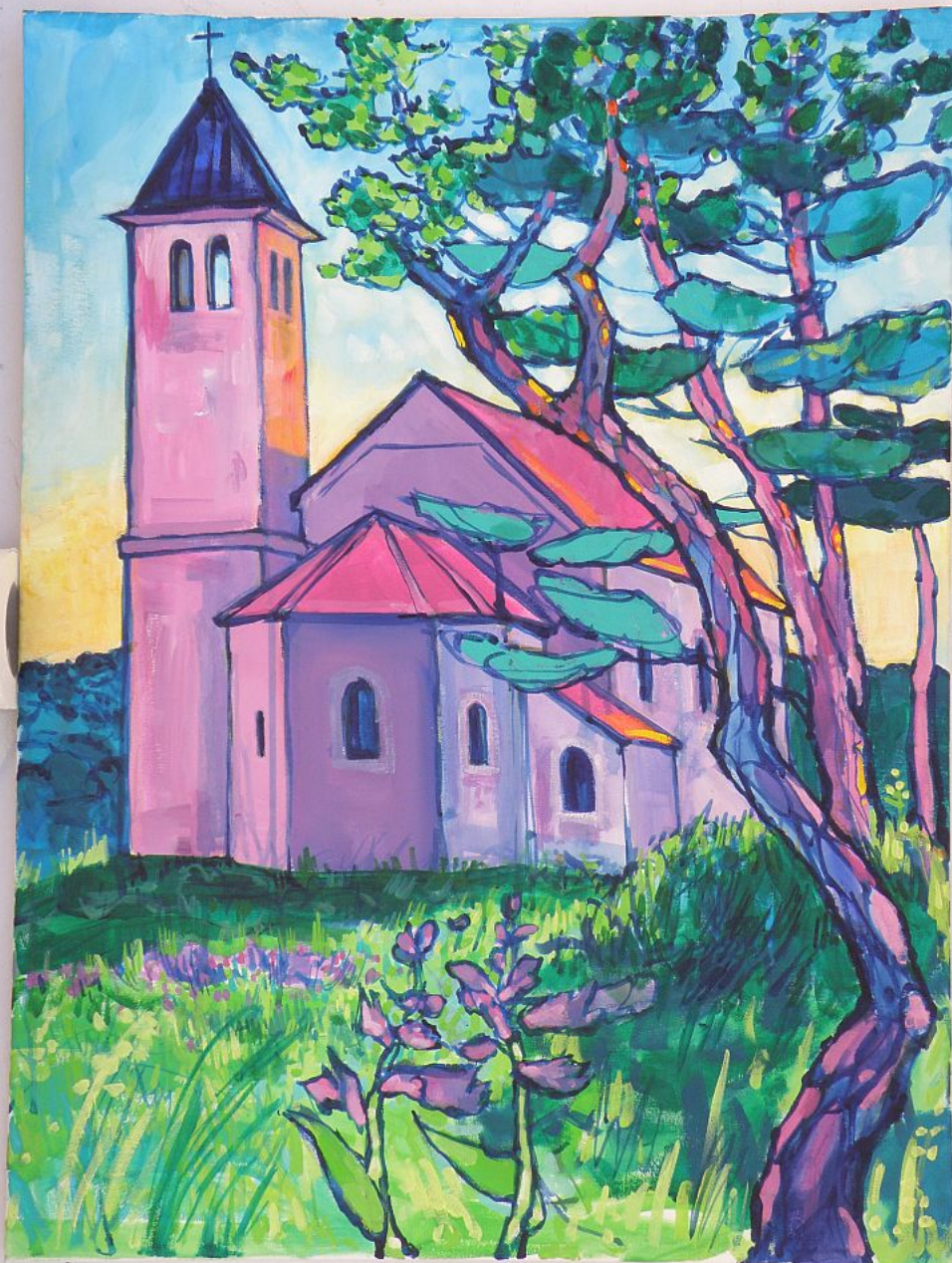
Ana Botteri Peruzović, Župna crkva u Vinici s istočne strane

Utorak, 15 Svibanj 2012 20:38 - Ažurirano Subota, 16 Lipanj 2012 12:14